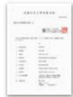
地盤改良工事検査済証

施工不良による沈下事故を防ぐため、専門の教育を受けた「地盤インスペクター®」が改良工事を現場で検査します。適切かつ安全な工事が確認致します。