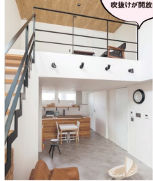
リビング階段を取り入れた 収納が開放的!

家族が楽しく、寛げるLDKは、使いやすさはもちろん、おしゃれなデザインにもこだわり、いつでも家族の繋がりが感じられる空間です。