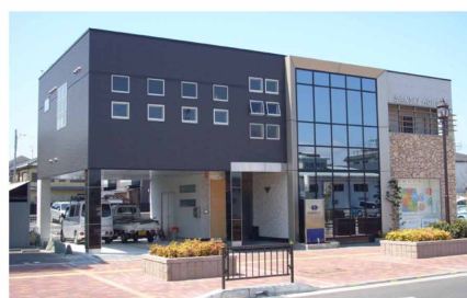
本社・ショールーム外観